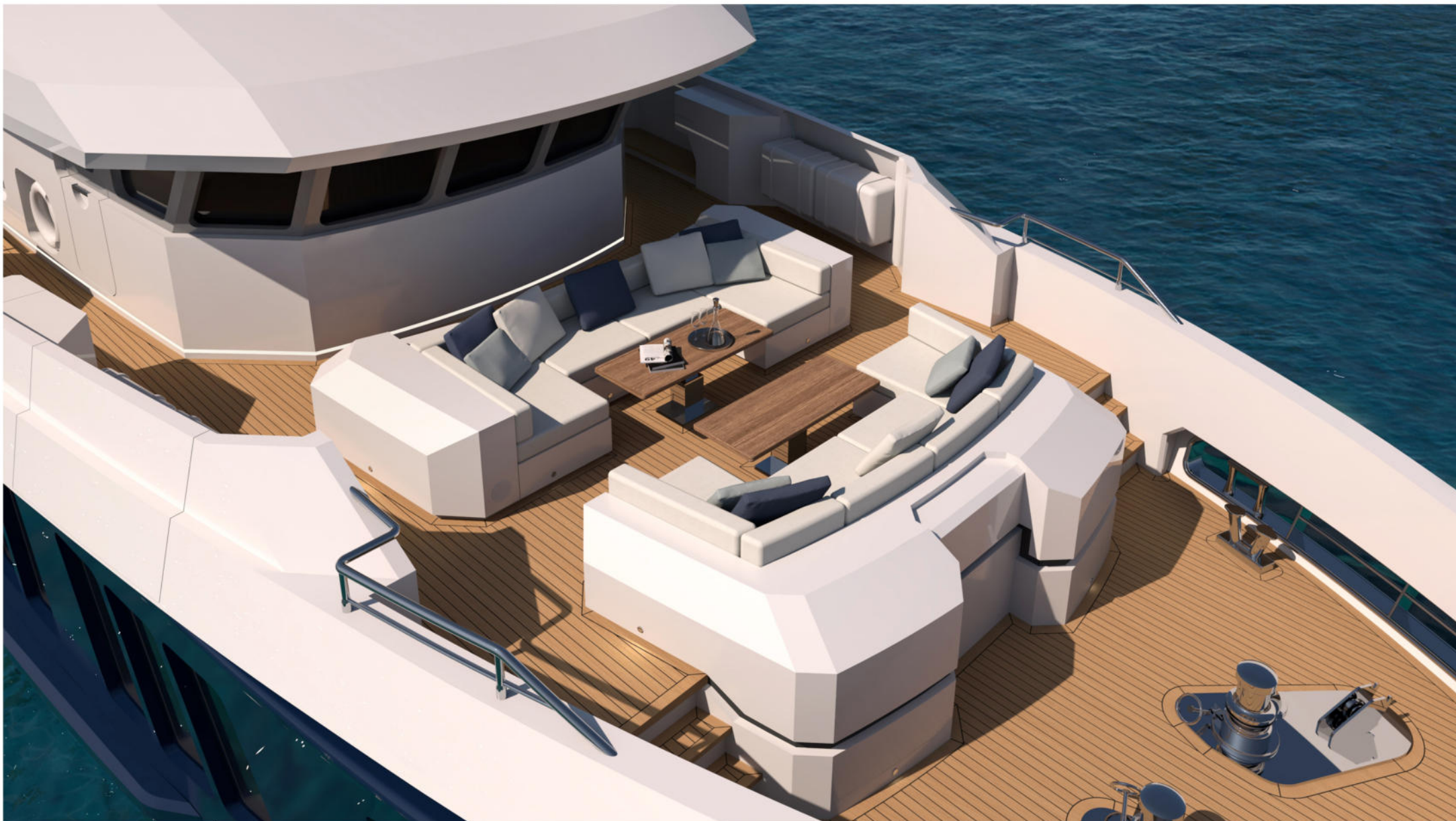
35 mt Motor Yacht Explorer "BEE"