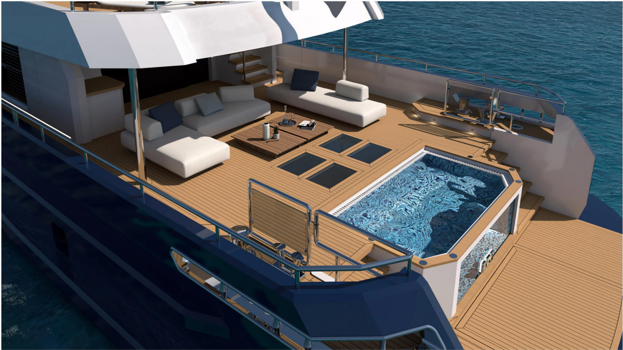
35 mt Motor Yacht Explorer "BEE"