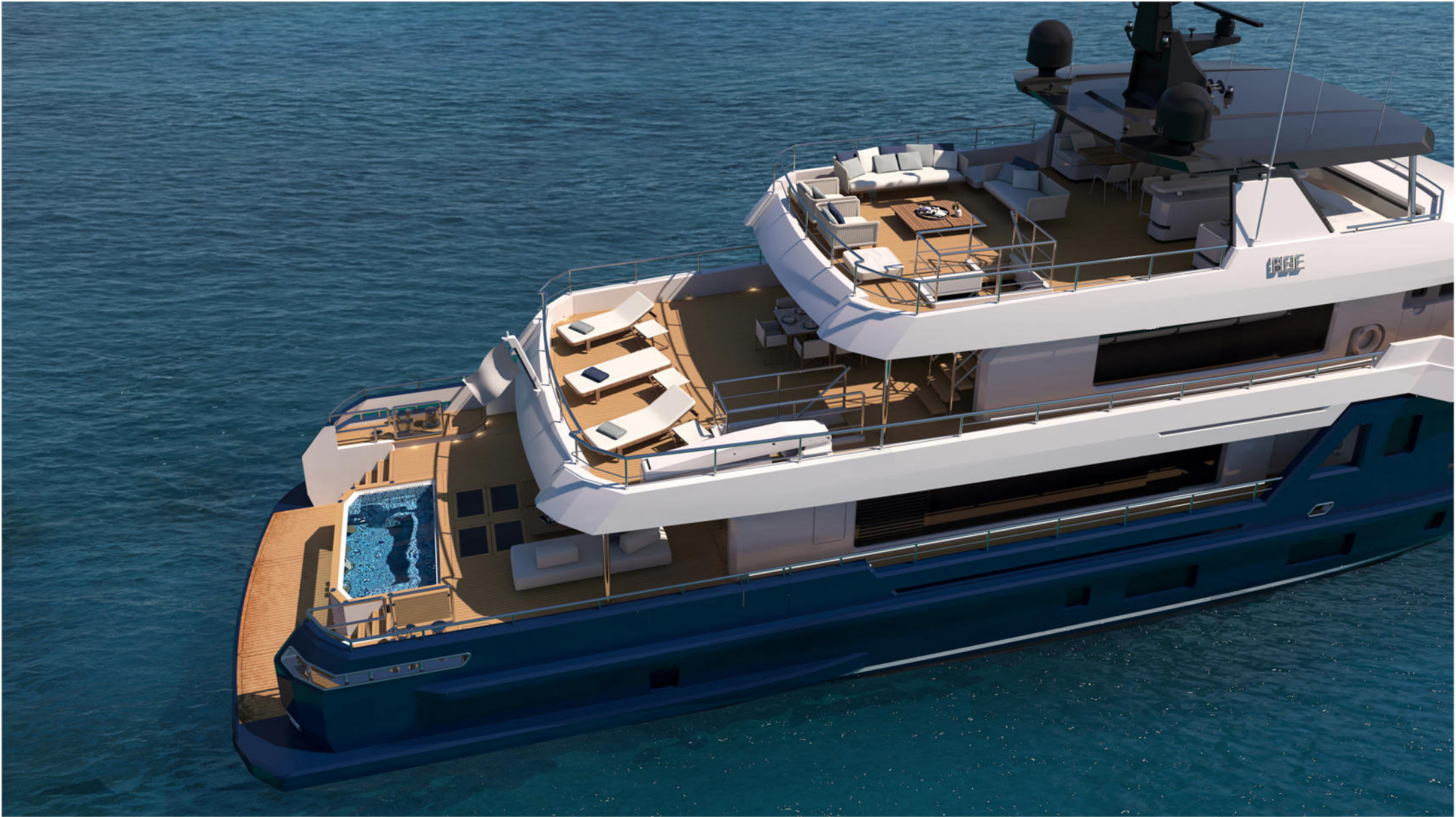
35 mt Motor Yacht Explorer "BEE"