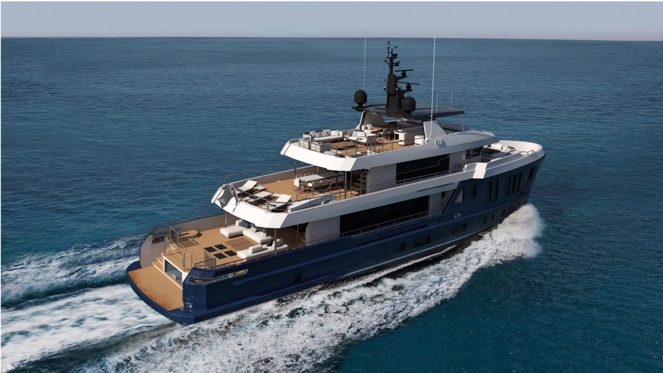
35 mt Motor Yacht Explorer "BEE"