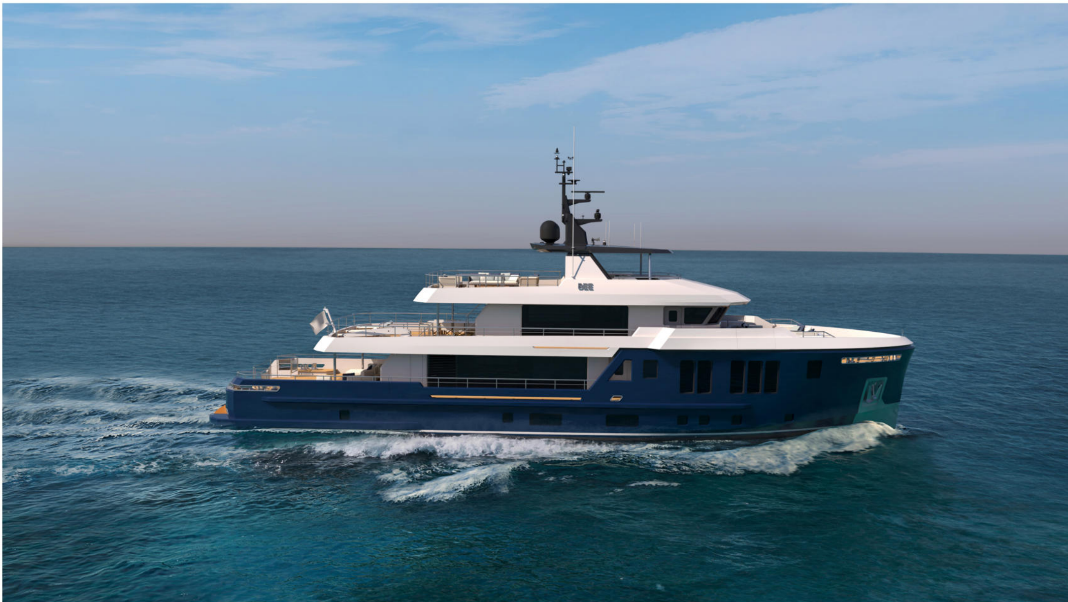
35 mt Motor Yacht Explorer "BEE"