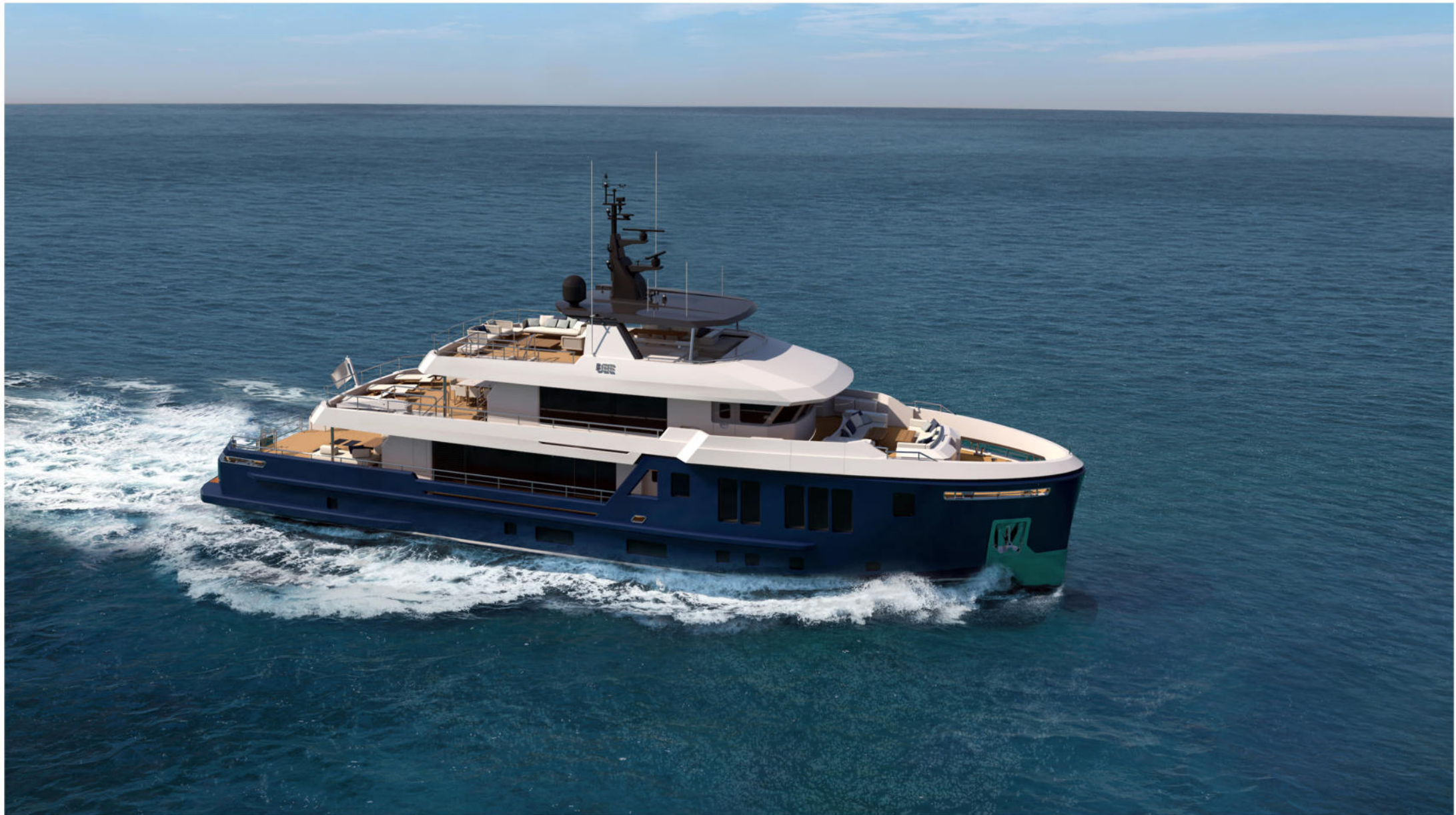
35 mt Motor Yacht Explorer "BEE"