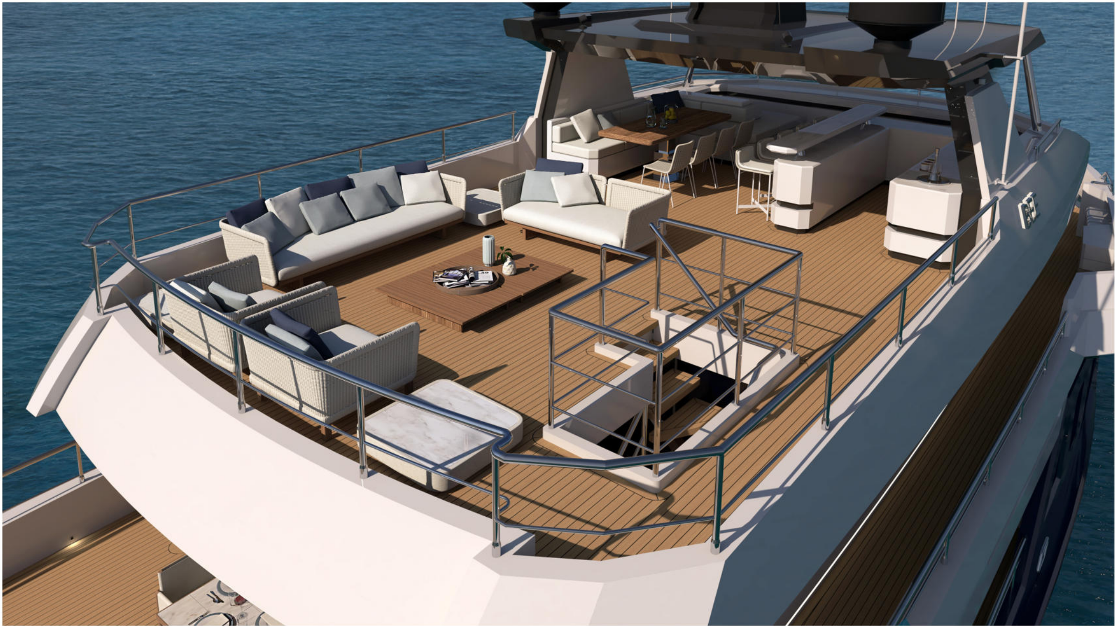
35 mt Motor Yacht Explorer "BEE"