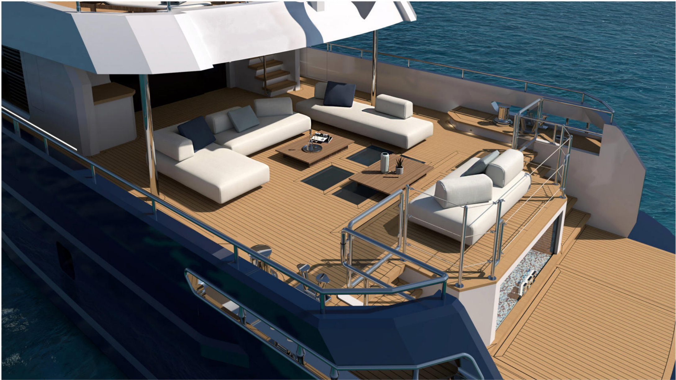
35 mt Motor Yacht Explorer "BEE"